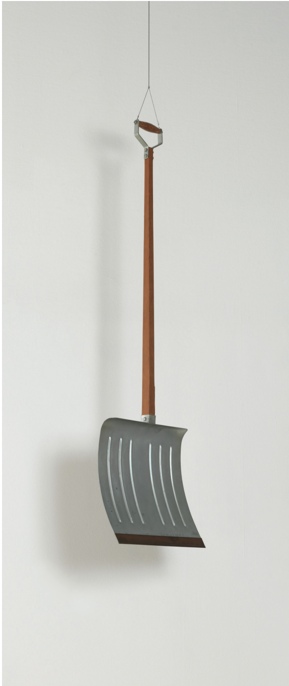
Marcel Duchamp, In Advance of the Broken Arm, 1915/1964 hout en gegalvaniseerd ijzer • Paris, MNAM-Centre Pompidou • Copyright artwork: © Association Marcel Duchamp / Adagp, Paris