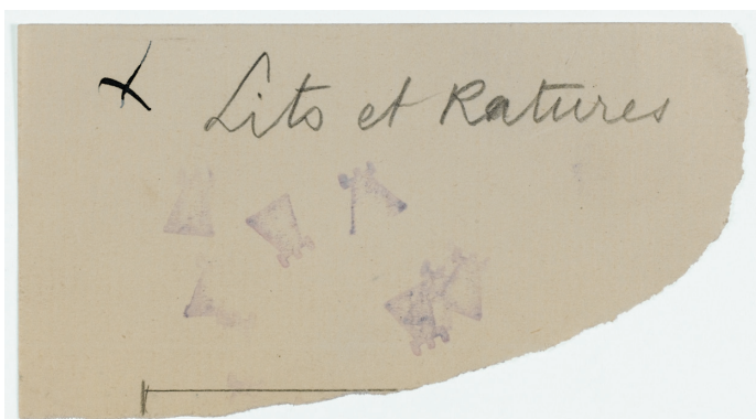
Marcel Duchamp, Lits et Ratures, 1912/1968 potlood en paarse stempels op gescheurd papier • Parijs, MNAM-Centre Pompidou. Copyright artwork: © Association Marcel Duchamp / Adagp, Paris

Readymades spelen met het contrast tussen een industrieel vervaardigd voorwerp uit het dagelijks leven en de titel van het werk. Het beroemdste voorbeeld daarvan is ongetwijfeld het porseleinen urinoir Fontaine, een van de belangrijkste stukken van de tentoonstelling.