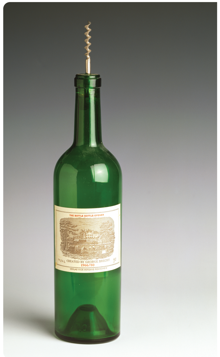
George Brecht, The Bottle Bottle-Opener, 1966/1980 glas, metaal, kurk, papier • Paris, MNAM-Centre Pompidou. Copyright artwork: © Adagp, Paris