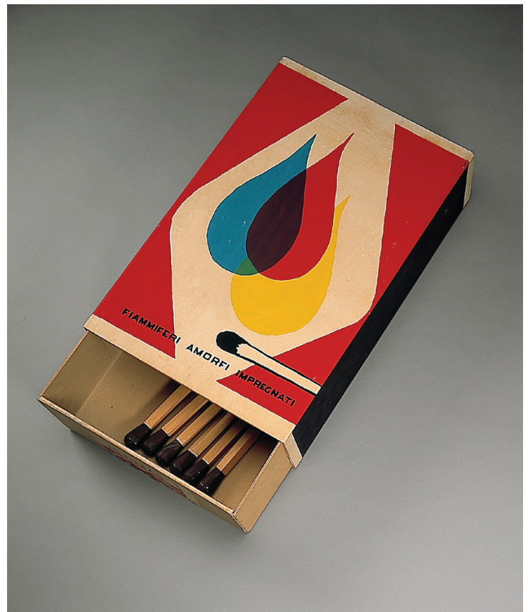
Raymond Hains, Hommage à Mondrian et à de Chirico, 1971 kist in multiplex, bedrukt papier, karton, hout, overschilderde stopverf Parijs, MNAM-Centre Pompidou. Copyright artwork: © Adagp, Paris

Begin jaren 1980 ensceeneert de naar New York uitgeweken Russische kunstenaar Alexander Kosolapov in een aantal schilderijen de bizarre ontmoeting tussen Kazimir Malevitsj en Marlboro. Kosolapov plaatst de naam van Malevitsj in hetzelfde lettertype als dat van Marlboro op een wit-rood oppervlak, wat doet denken aan de beroemde sigarettenpakjes en, via de associatie met de naam van de kunstenaar, aan de geometrische kleurvlakken van het suprematisme. Kosolapov ontwijdt de heilige beeldende ruimte van Malevitsj des te meer door het motief op ironische wijze driemaal te herhalen volgens het aloude principe van de triptiek. In de context van het einde van de Koude Oorlog staat die atypische combinatie ook voor de unie van twee totaal verschillende culturen.