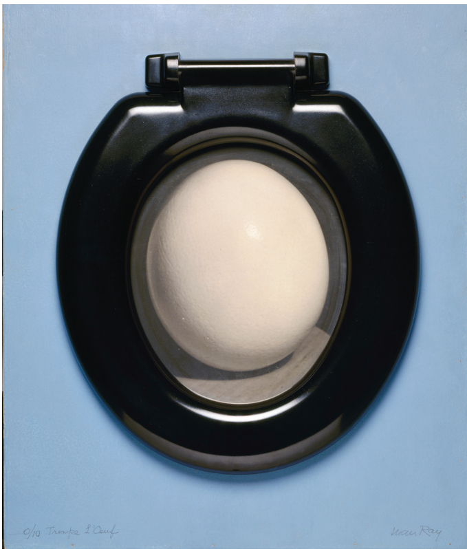
Man Ray, Trompe l'œuf, 1930-1963 assemblage, foto, bakelieten wc-bril, Parijs, MNAM-Centre Pompidou • Copyright artwork: © Man Ray Trust / Adagp, Paris

In de geest van de readymades combineert Trompe l'œuf de foto van een struisvoegelei met een bakelieten wc-bril, die als omlijsting dienstdoet. Het werk is zowel een visueel als een tekstueel woordspel. Het speelt met de klankverwantschap tussen œil (oog) en œuf (ei) in de samenstelling trompe-l'œil. De assemblage van de diverse elementen werkt als een trompe-l'oeil. De foto van het ei wekt namelijk de illusie van een echte wc-bodem in wit email. Door een wc-bril als omlijsting te gebruiken, breekt Man Ray spottend met de normen voor hoe een kunstwerk er moet uitzien.