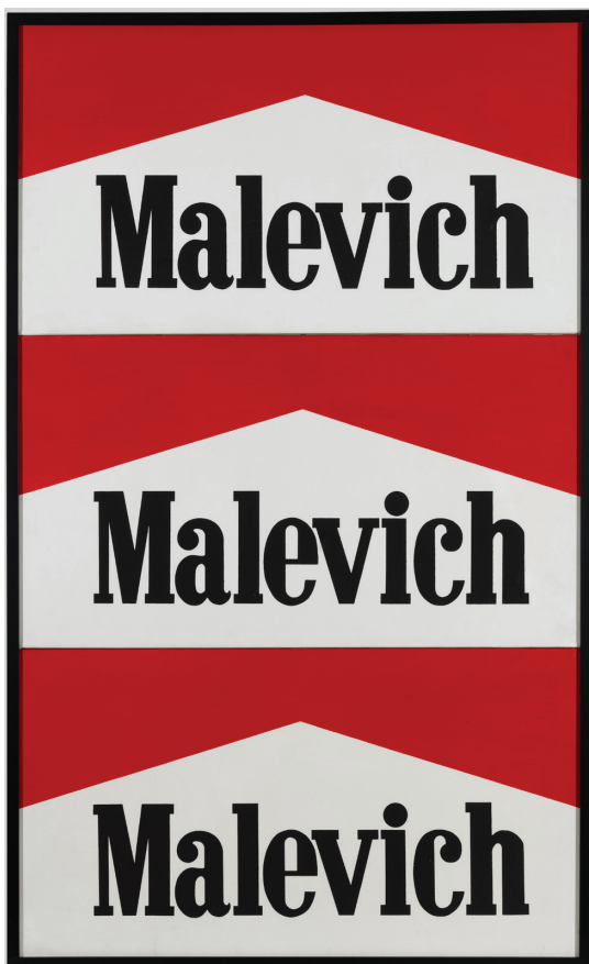
Alexander Kosolapov, Triptyque Malevitch-Marlboro, 1985 acrylverf op doek, Parijs, MNAM-Centre Pompidou. Copyright artwork: © Adagp, Paris

Vanaf het moment dat de 19e-eeuwse pers 'parodiërende salons' begint te publiceren, zorgen parodie en vermomming voor een lach, doordat ze breken met een bepaalde orde in de kunst. Vanaf het einde van de jaren 1970 geeft de Belg Marcel Mariën Piet Mondriaan ervan langs. Zijn Mondrianités zijn composities waarin de beroemde blauwe, rode en gele vlakken van de Nederlandse schilder worden vervormd tot zeer satirische werken. Mariën gebruikt elementen uit alle tijdperken, van het Egyptische bas-reliëf tot antieke standbeelden. In de jaren 1990 dienen Ernest T. en Sylvie Fleury hem van replek met smakelijke persiflages op Mondriaan.