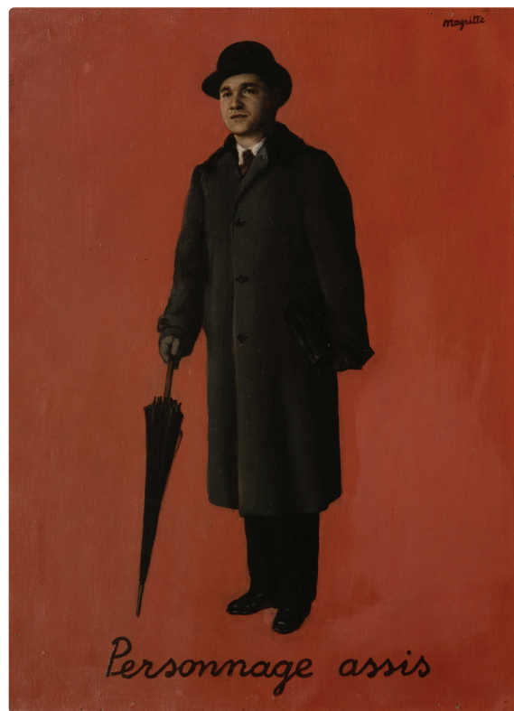
René Magritte, Le bon exemple, 1953 olie op doek • Parijs, MNAM-Centre Pompidou. •

Hahaha. De humor van de kunst brengt meer dan 200 kunstwerken bij elkaar. Ze zijn vooral uit het Centre Pompidou afkomstig, en sommige werken zijn nog niet vaak of zelfs nog nooit getoond. De collectie uit Parijs is aangevuld met een twintigtal Belgische werken uit de collectie van ING België, uit privécollecties en via kunstenaars zelf. Het team werkte bijvoorbeeld nauw samen met Wim Delvoye en Guillaume Bijl om de getoonde werken te selecteren.